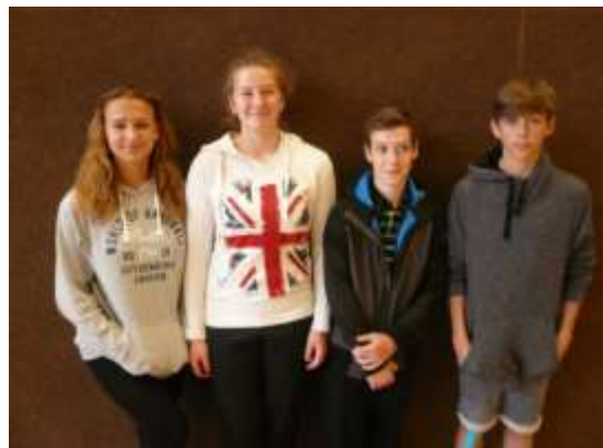
Dopravní soutěž mladých cyklistů