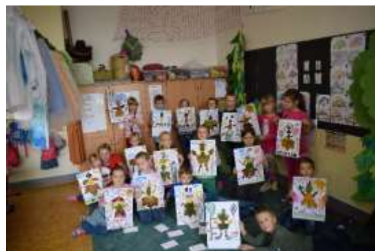
Slavnost skřítků a víl