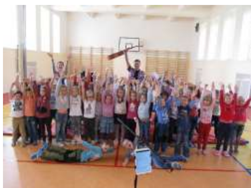
Družina žije hudbou