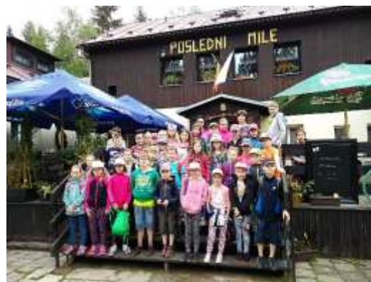
Škola v přírodě