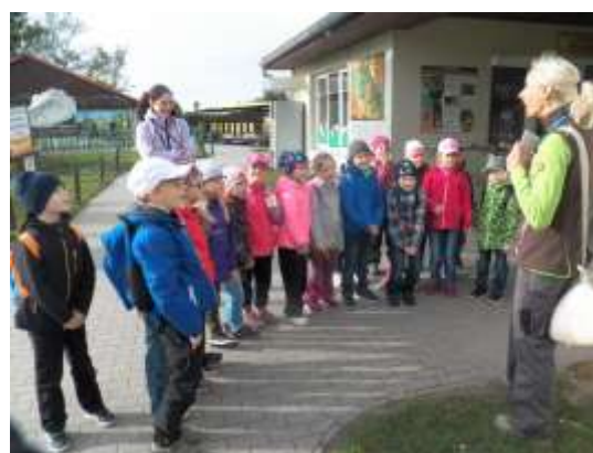
Exkurze Hanácký statek