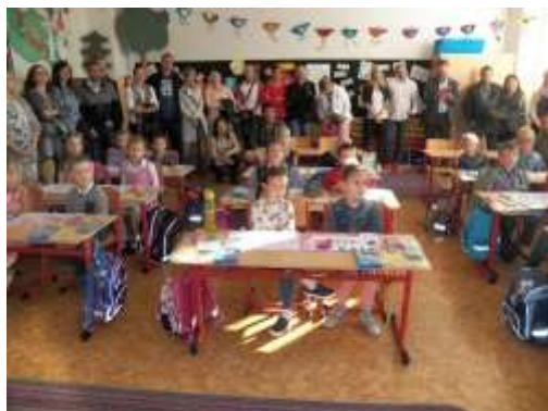
První školní den