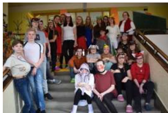
Zápis do 1. ročníku