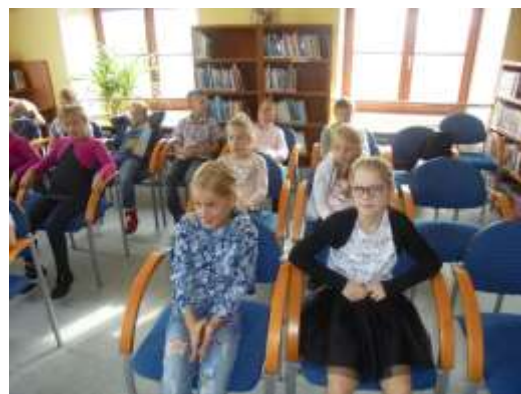
Pasování na čtenáře