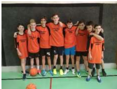
Okrskové kolo v basketbale