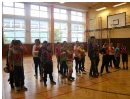
Dopravní soutěž mladých cyklistů